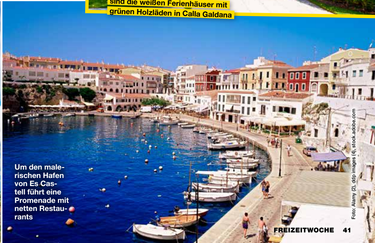
Um den maleischen Hafen von Es Castell führt eine Promenade mit netten Restaurants