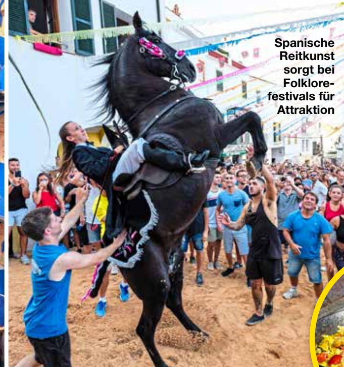
Spanische Reitkunst sorgt bei Folklorefestivals für Attraktion