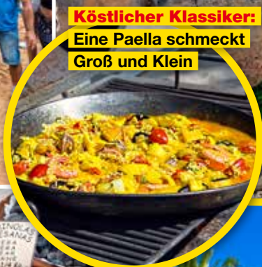
Köstlicher Klassiker: Eine Paella schmeckt Groß und Klein