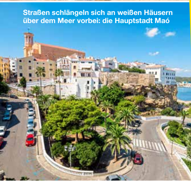
Straßen schlängeln sich an weißen Häusern über dem Meer vorbei: die Hauptstadt Maó