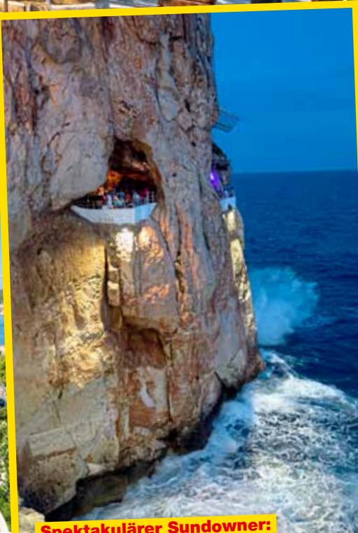
Spektakulärer Sundowner: Die Bar und Musikclub Cova d'en Xoroi an der Südküste bei Cala en Porter liegt auf einem Felsvorsprung