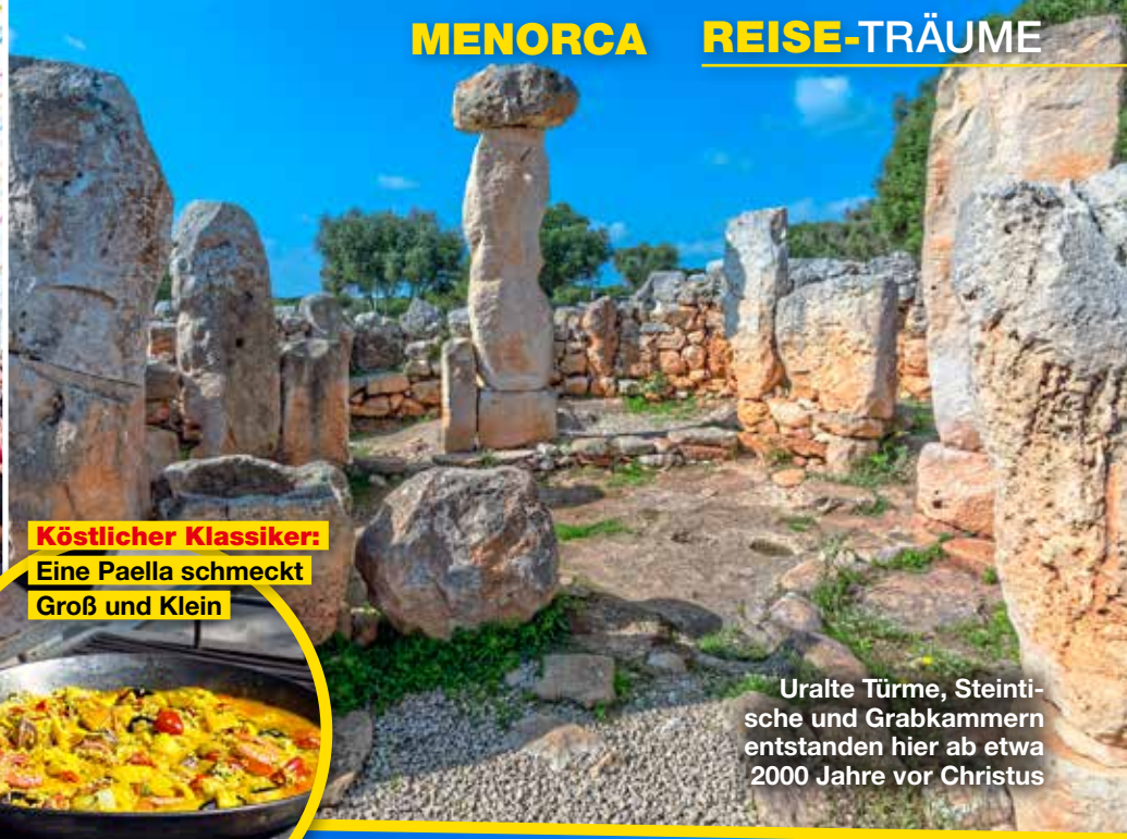
Uralte Türme, Steintische und Grabkammern entstanden hier ab etwa 2000 Jahre vor Christus