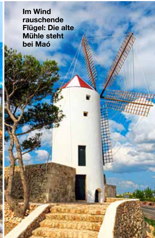
Im Wind rauschende Flügel: Die alte Mühle steht bei Maó