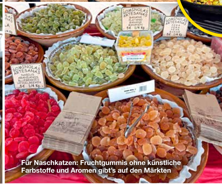
Für Naschkatzen: Fruchtgummis ohne künstliche Farbstoffe und Aromen gibt's auf den Märkten