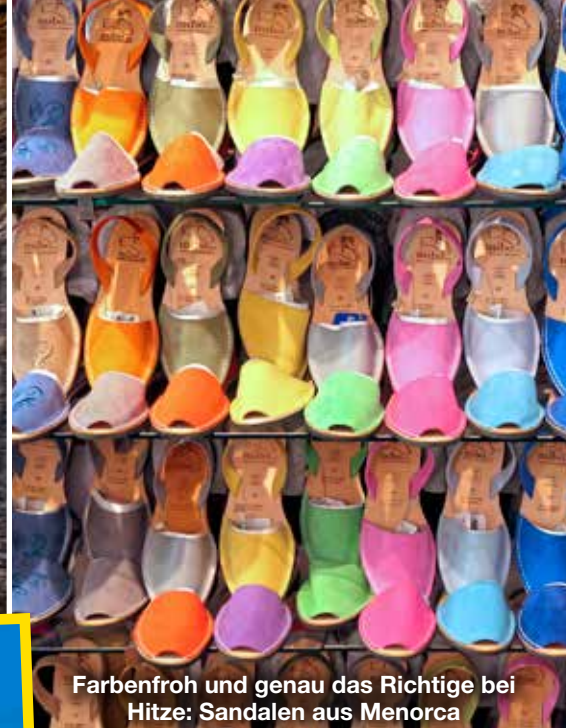
Farbenfroh und genau das Richtige bei Hitze: Sandalen aus Menorca