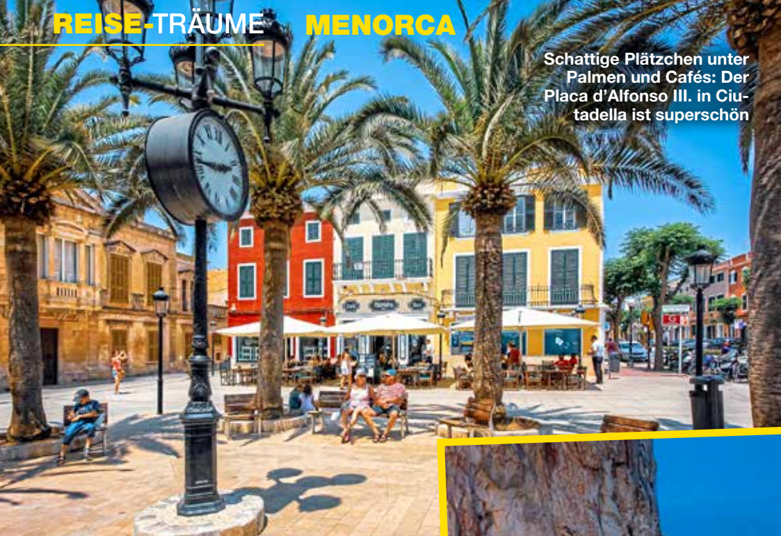
Schattige Plätzchen unter Palmen und Cafés: Der Placa d'Alfonso III. in Ciutadella ist superschön