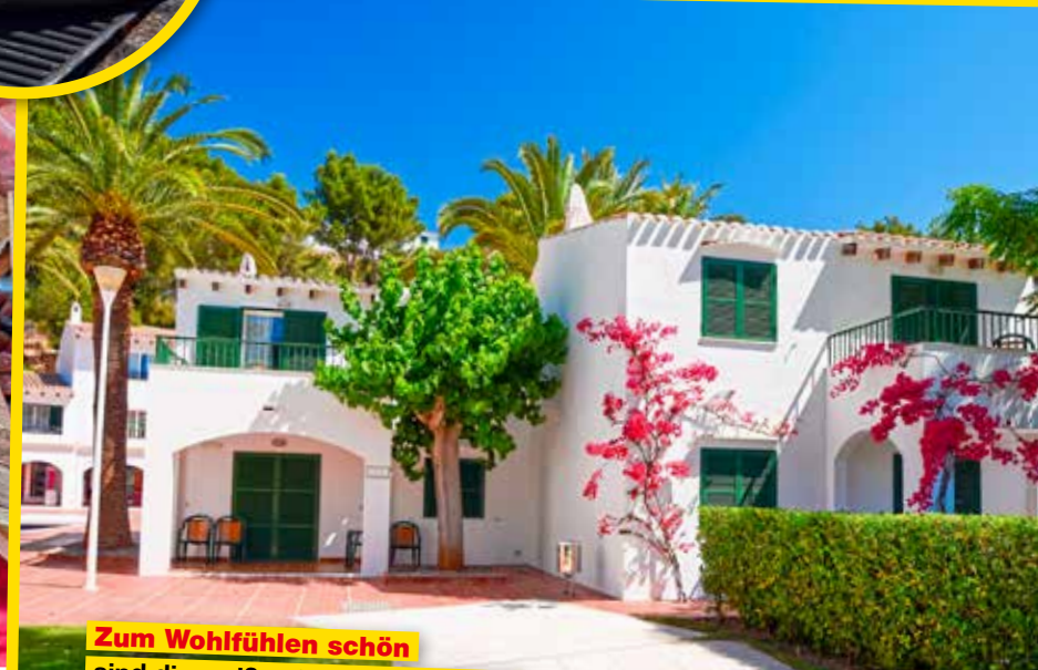
Zum Wohlfühlen schön sind die weißen Ferienhäuser mit grünen Holzläden in Calla Galdana