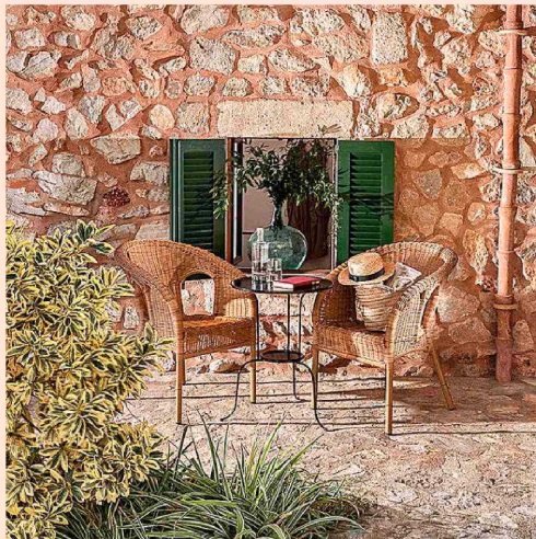
Can Beneit, en la sierra de la Tramuntana (Mallorca), se ubica en una antigua granja.

sino que tienen novedades en la recámara. Room Mate Olivia , previsto para junio, será el primer hotel de costa de Kike Sarasola y estará en Calviá. Propiedad de HIP, contará con el interiorismo de Jaime Beriestain, 391 habitaciones y cuatro piscinas exteriores.