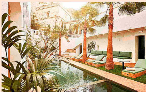
Los dos nuevos palacios que se incorporan a Can Faustino añaden 20 habitaciones.

La huella de la familia Matutes no se limita a Ibiza. Su último paso es Palladium Hotel Menorca , un resort de 264 habitaciones a 20 minutos del aeropuerto y de Mahón. Previsto para el 28 de mayo, será la segunda propiedad de Palladium Hotels fuera de la isla Blanca. Tendrá un restaurante, Sa Barca, especializado en showcooking , tres bares (uno en la piscina) y un bar teatro de comedia.