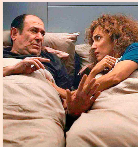
'Poliamor para principiantes', comedia de Fernando Colomo, ahora en cines.

Presenta ahora Fernando Colomo Poliamor para principiantes , una comedia muy suya: clásica por sus concepciones, basadas en la explosión de ciertas secuencias maravillosamente divertidas como la de la asistencia de padre e hijo a un encuentro de practicantes del poliamor, alegre promiscuidad amorosa sin perder amarras que se diría en otros tiempos, con una deriva que oscila entre una ironía sutil ante ciertas situaciones y el reconocimiento de las libertades y elecciones de cada uno. Fidelidad o relación abierta, romanticismo o no desperdiciar ocasiones, y la habilidad de Colomo, un estupendo guionista, para encuadrar la narra-