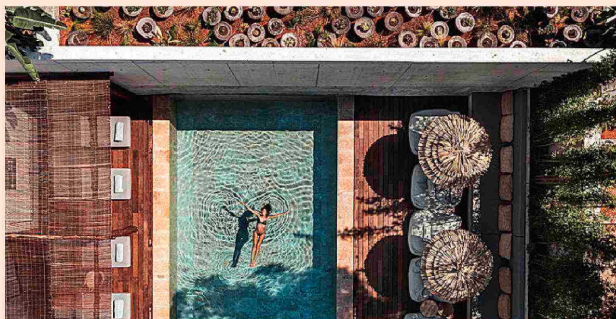
OKU Ibiza tiene varias piscinas, la principal, con 50 metros, es la más grande la isla.