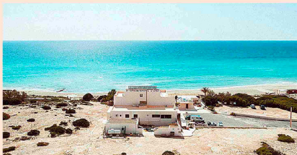
Formentera, con muy pocos hoteles, estrena Casa Pacha Formentera, de 14 habitaciones.